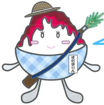
やまのべかき氷マスコットキャラ 『すだまりん』ちゃん

すだまり氷は、山辺にむかーしから伝わる伝統のかき氷！イチゴシロップに酢じょうゆをかけて食べるから、甘じょっぱくて後味さっぱり。ちょうどいいすだまり加減を探してみてね。