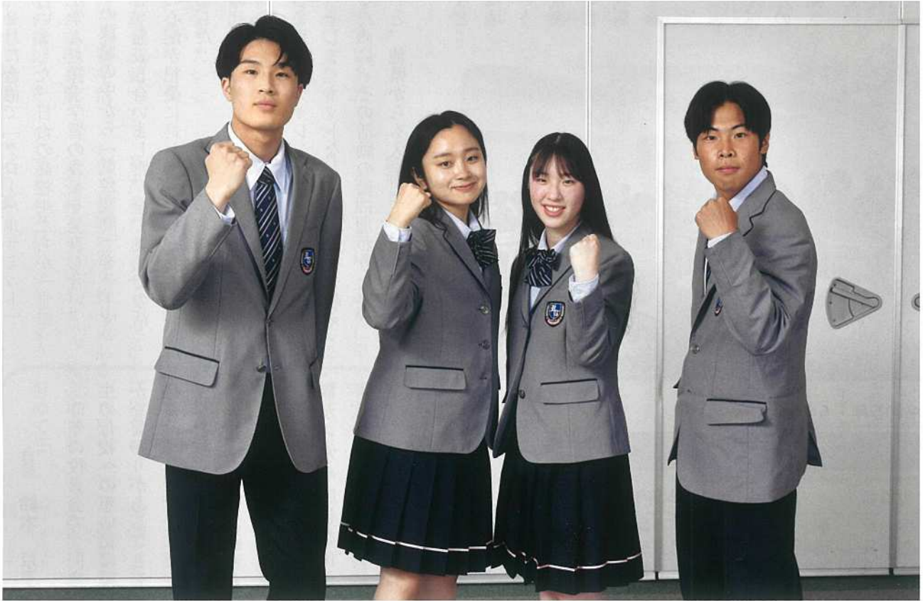
令和5年4月からの新しい制服

発行 〒 992-0039 山形県米沢市門東町1丁目1番72号 九里学園同窓会 事務局 TEL0238-22-0091 FAX0238-22-0092