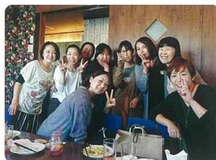
卒業生がお祝い会をしてくれました (2017年)

二〇一七年の三月に定年退職して七回目の春を迎えました。教職は離れましたが、街中などそちらこちらで卒業生の皆さんにお会いすると本当にうれしくなります。