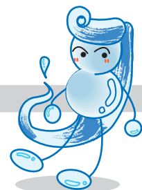
モガミガワ君 作・あき