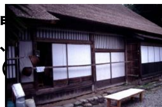
重要文化財 佐竹家住宅