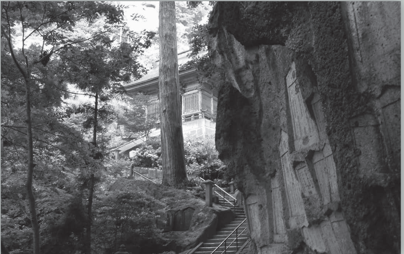
立石寺(山寺)仁王門付近