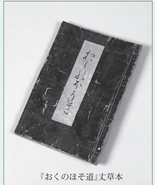
『おくのほそ道』文草本

山形領に立石寺と云山寺あり。慈覚大師の開基にして、殊静閑の地也。一見すべきよし、人々のすゝむるに依て、尾花沢よりとつて返し、其間七里ばかり也。日いまだ暮ず。麓の坊に宿かり置て、山上の堂にのぼる。岩に巖を重て山とし、松栢年旧、土石老て苔滑に、岩上の院々扉を閉て物の音きこえず。岸をめぐり、岩を這て、仏閣を拝し、佳景寂寞として心すみ行のみおぼゆ。