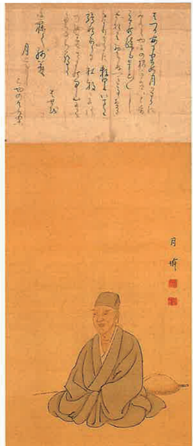
芭蕉「馬に寝て」句文懐紙（附 丹家月隱筆 芭蕉肖像） 松尾芭蕉 筆 芭蕉诗文（附丹家月隱的芭蕉画像）松尾芭蕉的手迹 本馆收藏