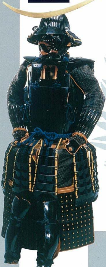
重文 黒漆五枚胴具足 伊達政宗 所用 仙台市博物館 蔵