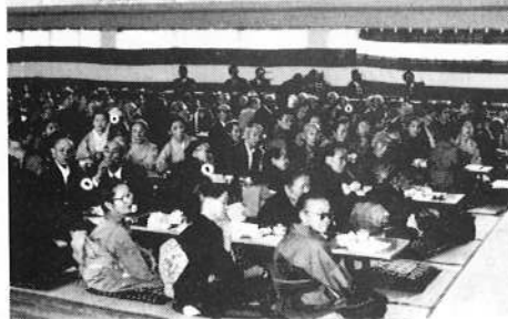
9/15 敬老会 (平野小学校体育館にて)