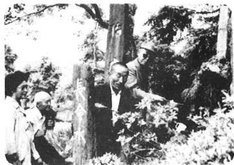
9/20~21 野川学級研修旅行 天童へ