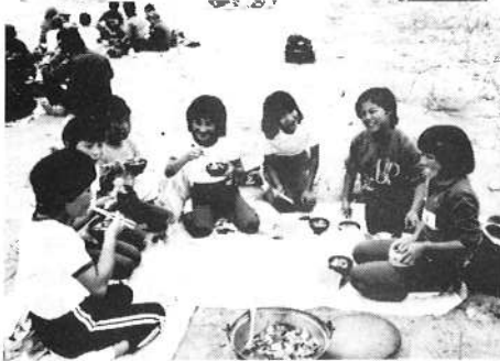
9/23 第4回ふるさと少年教室 オリエンテーリングといも煮会