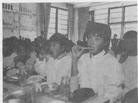
多目的ホールでの一斉歯みがき

この関心が高まり基礎的知識も身につく、予防に対する意識の向上がみられるようになった。