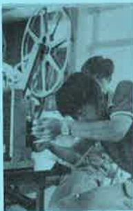
映写機操作技術講習会開く

去る二十九日、高校生を対象に16mmの映写機操作講習会が開かれた。初めての試みでしたが熱心に操作を受けていました。全員に操作許可書が交付されました。