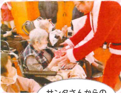
サンタさんからのプレゼント