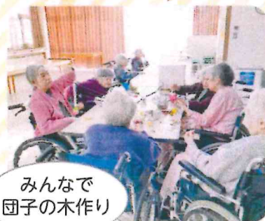
みんなで団子の木作り