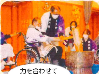
力を合わせて「よっこいしょ!!」