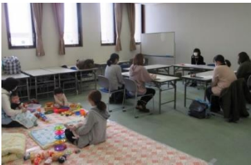
セミナーはお子さんと同室で受講できます

再就職・転職・復職など、おしごとを考えているママのための「おしごと相談会」です。就職活動を進めるための、いろいろな情報・知識を得ていただく「セミナー」の開催や、不安を少しでも解消していただくような「個別相談会」を行っています。就職活動前で、何かを始めたいと思っている方も大歓迎です！お子さんとご一緒に、お気軽におこしください。