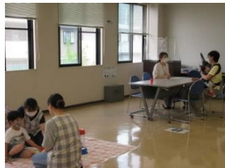
ご相談は個別で対応いたします