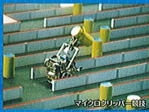
マイクロクリッパー競技