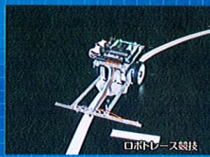
ロボットレース競技