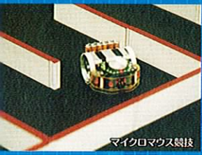
マイクロマウス競技