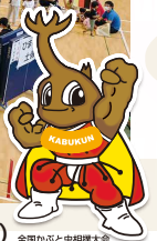
第30回全国かぶと虫相撲大会(7月17日祝海の日)