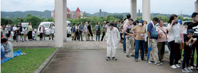
元祖芋煮会in中山 お楽しみ抽選会(9月30日)