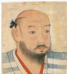
▲足利義輝像紙形(京都市立芸術大学芸術資料館蔵) 通期