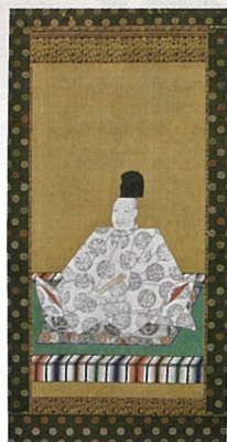
▲正親町天皇像(泉涌寺蔵) 通期