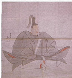
▲足利義昭画像(東京大学史料編纂所蔵模写) 後期