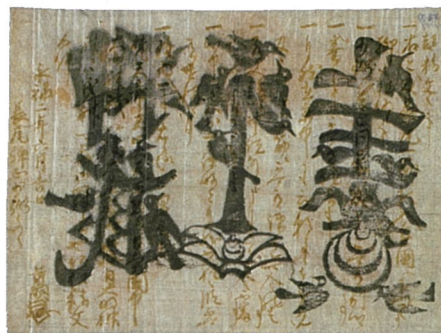
▲国宝「上杉家文書」近衛前久血書起請文(当館蔵) 前期