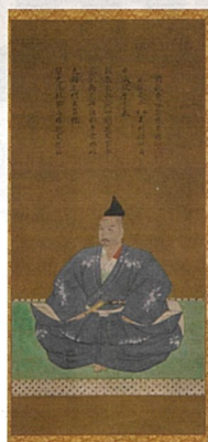
▲重要文化財 三好長慶像(聚光院蔵) 前期