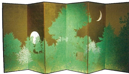
「朝暘と三日月」 福王寺一彦 2017年 再興第102回院展 ©Kazuhiro FUKUOJI JASPAR, TOKYO 2023