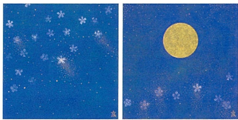
高野山金剛峯寺襖絵下絵「月 星 花」 福王寺一彦 2022年