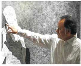
福王寺一彦 KAZUHIKO FUKUOJI

1955年生まれ。父福王寺法林に師事。 1974年 成城学園高等学校卒業。 1978年「追面影」で院展初入選。自然を表現する独自の繊細な画風で知られます。 2001年「月の耀く夜に三」で日本芸術院賞を日本画部門史上最年少で受賞。 2017年ルーブル美術館国民美術協会 (SNBA)主催芸術展にて、優秀賞及び審査員特別賞を受賞。 現在日本藝術院会員、日本美術院同人、日本美術家連盟理事、文芸美術国民健康保険組合理事長、日本美術著作権協会 (JASPAR)会長。 父法林譲りの美しい青の色彩を根底としてさらに独自の技法による奥深い青や緑を生み出しています。その透明感あふれる美しい輝きは自然の美しさと緊張感へのリスペクトに満ち、日本だけでなく、海外においても人々を魅了しています。