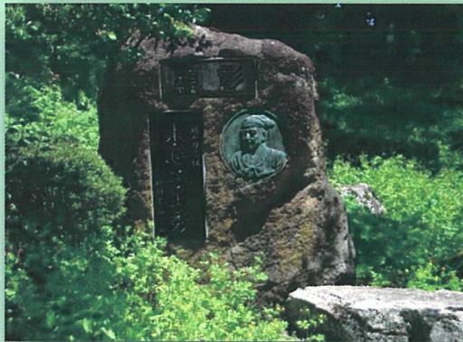
水心子正秀顕彰碑（烏帽子山八幡宮参集殿前）