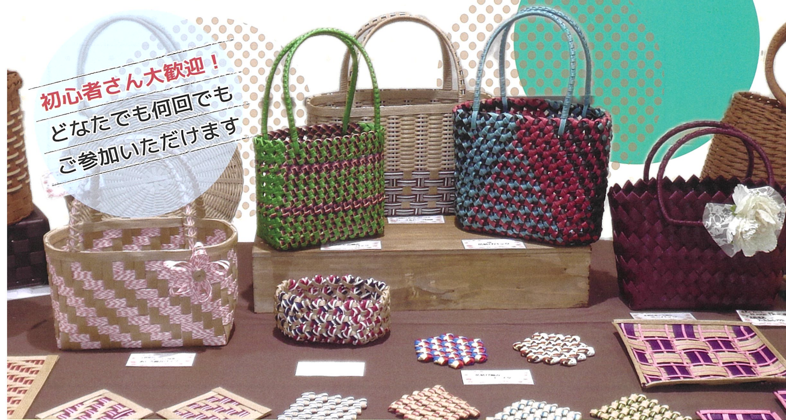
※写真はあくまでもイメージです。