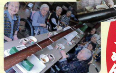
今から流すそうめん楽しみ