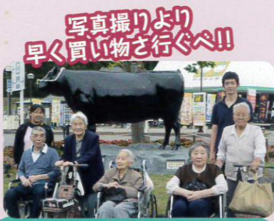
写真撮りより早く買い物に行くべ!!