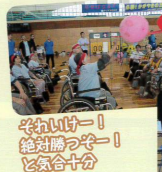
そわいけー! 絶対勝つぞー! と気合十分