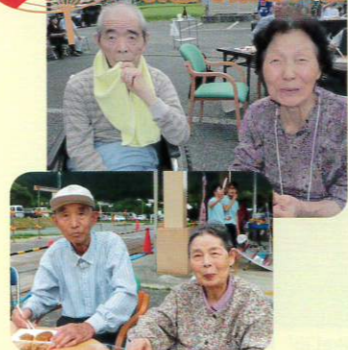
あゆみ祭 夫婦そろって お祭り楽しいね!