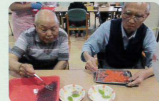
夏らしいおじさいができました