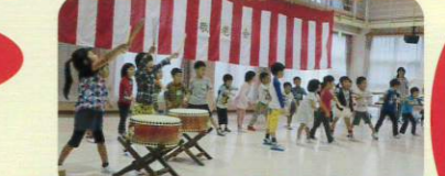
とってもかわいいお祝いをうけました