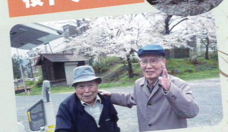
上山城へ桜ドライブ