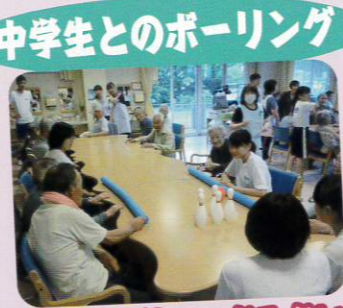
中学生とのボーリング