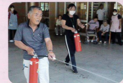
この真剣な目ざし!!