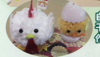
自分だけの干支や正月飾りを作りました