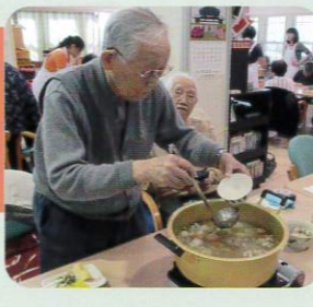
味つけはおてのもの