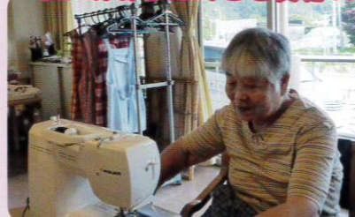
いとさんのミシン工房