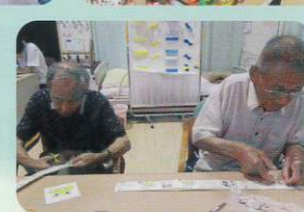
レクリエーション大会