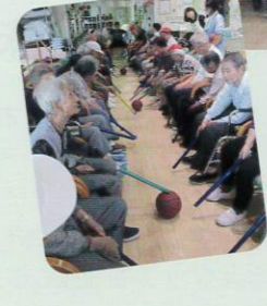
普段のらない車イスでのパン食い競走! 白熱したベンチサッカー 楽しかったあ