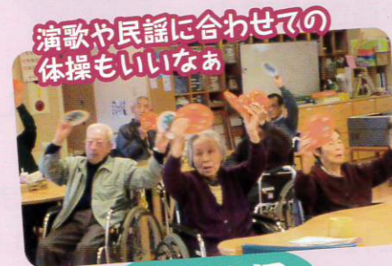
演歌や民謡に合わせての体操もいいなあ