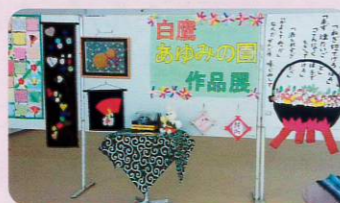
みんなで毎日ヨソヨソと...「継続は力なり」です