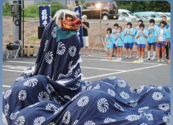
萩野子獅子保存会の子獅子 25 名の獅子舞。 大人にも劣らない勇壮な舞に、皆さん食入の様に見て いました。中には感動して涙する方もいらっしゃいました。