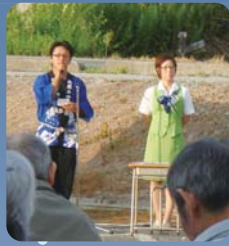
あゆみ祭実行委員長。 みなさんに喜んでもらえる 様子ががんばりました。