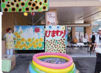
ご利用者様の手作り作品で 飾り付けられた、売店「ひまわり」