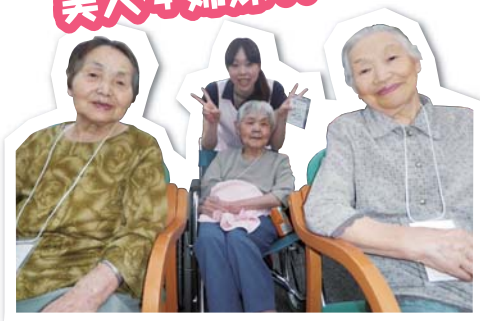
さて、これから皆で何を食べようか思案中。