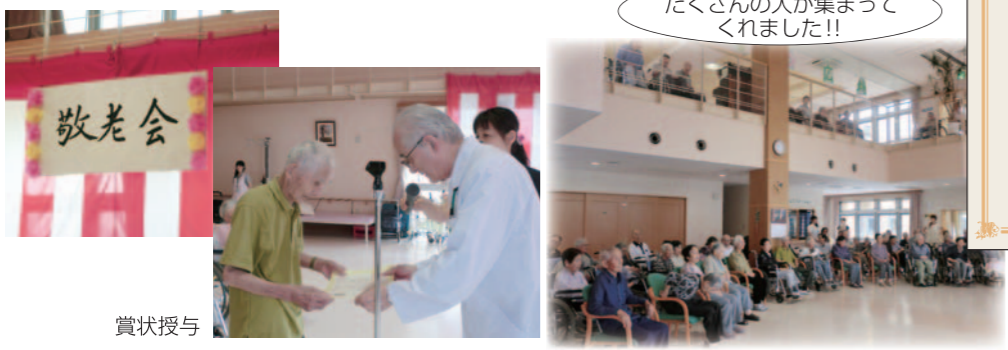
たくさんの方が集まってくれました!!

9月19日に白鷹あゆみの園で敬老会を行いました。 今年も右記の方々のお祝いをしました。 皆さん、本当におめでとうございます。