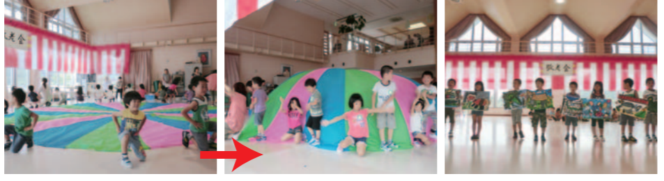
大きくふくらみます!!

あらと保育園の子ども達によるバルーンを使った踊りや、絵などの発表もあり、孫を思うおじいちゃん、おばあちゃんの顔に... とっても楽しい敬老会になりました。