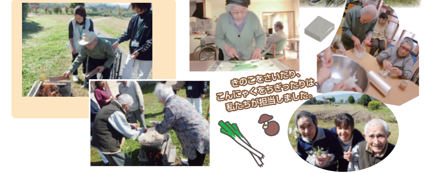
きのこをさいたり、こんにゃくをちぎったりは、私たちが担当しました。