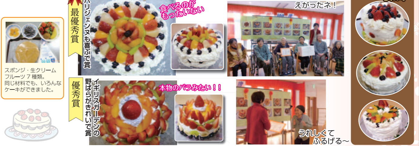
最優秀賞 スポンジ・生クリーム フルーツ 7 種類。同じ材料でも、いろんなケーキができました。