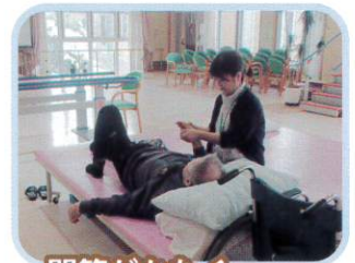
関節がかたく ならないように しっかり動かします。