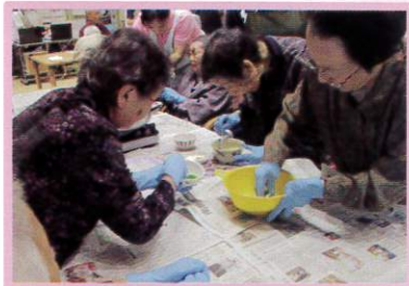
皆でおいしい草餅づくり

もぐさをゆで、白玉粉でねり、おいしくな〜れを言いながら作りました。舌がおっかけるくらいおいしくできました。