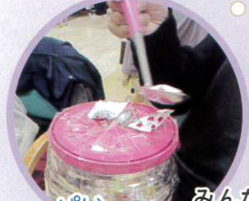
いっぱい取れたかなあ