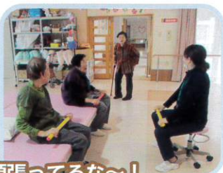
お!頑張ってるな~! 私も入れてける!