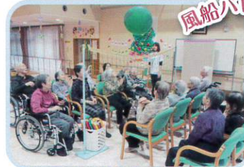
風船バレーボール♪