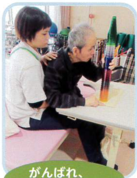
がんばれ、 がんばれ