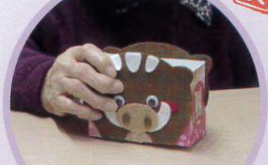
いのしし可愛くできたよ。