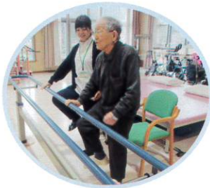
立っていただけるかな…? バランス練習。