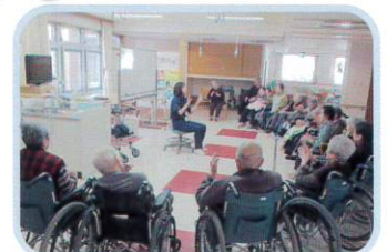
集団体操♪ 今日も始まりますよ~!