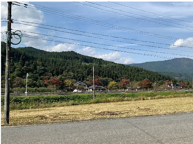
車庫前より西を望む あゆ茶屋