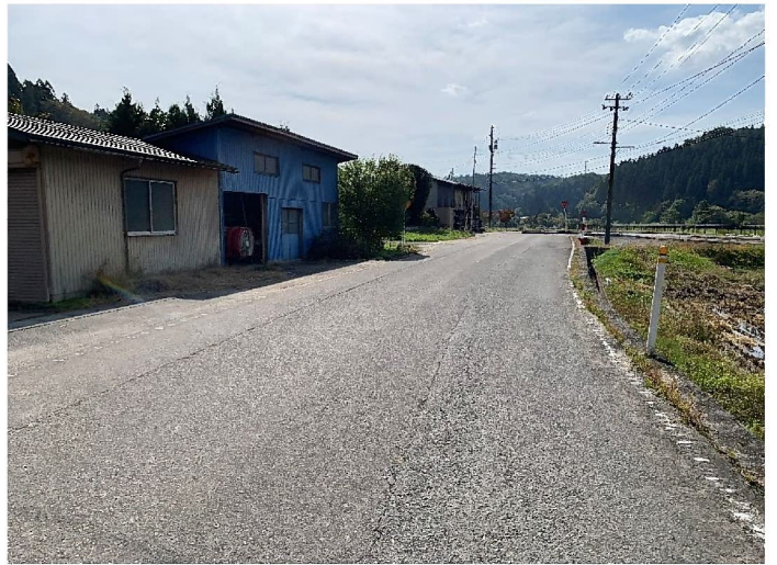
車庫・小屋前 町道