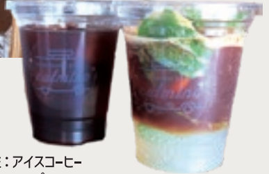
左:アイスコーヒー 右:エスプレッソモヒート