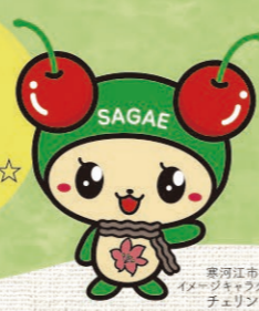
寒河江市イメージキャラクター チェリン