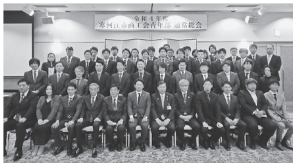
令和4年度青年部通常総会