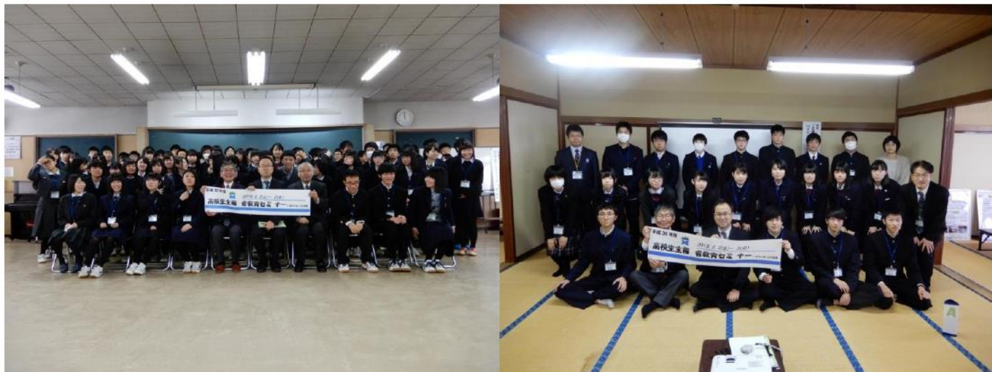
（昨年度のセミナー 集合写真 左：内陸会場、右：庄内会場）

※ 昨年度に引き続き、県内各学校の生徒会同士の交流と主権者として高校生の話し合いの場づくりをします。内陸（遊学館）と庄内（庄内農業）の2会場で、実施（日帰り）します。