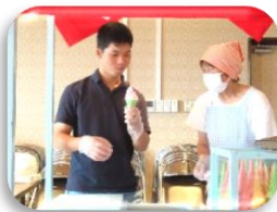
令和5年度の活動の様子