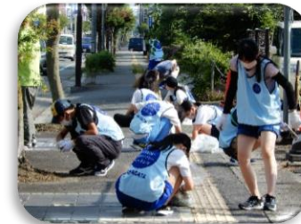
令和4年度の活動の様子①