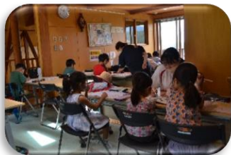
令和4年度の活動の様子②