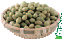
夏は枝豆として食す地元産の味の濃い青豆。