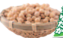
飽きのこない大豆本来の味と香りを楽しむことができます。