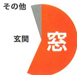
平成30年 警視庁調べ