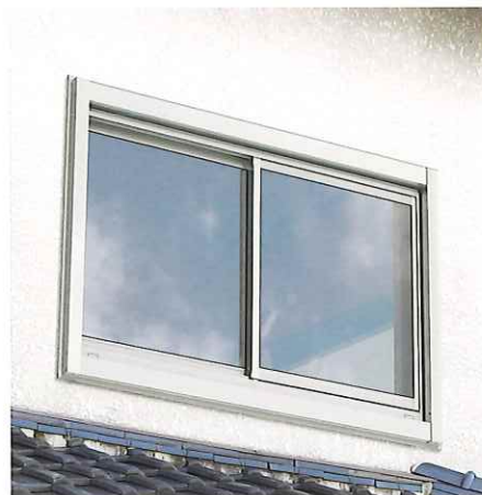
引違い窓・装飾窓に 取付け可能です