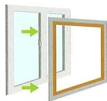
2 土台を作り、新しい枠を取り付ける