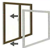
1 今ある窓の障子を外す