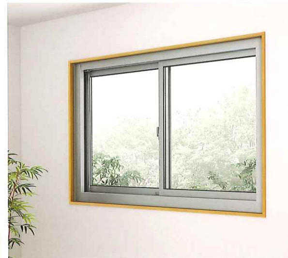
LIXIL リプラス カバーモール