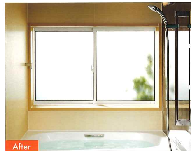
LIXIL リプラス カバーモール浴室用