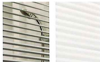
ブラインドは2枚のガラスの間にあるので、お掃除の手間もありません。