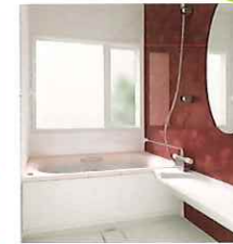
FIX窓+縦すべり出し窓