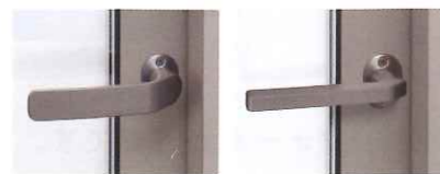
標準ハンドル スリムハンドル(選択品)

スマートなデザインのスリムハンドルもご用意。どちらのハンドルも、室内側は熱を伝えにくい樹脂製を、室外側は耐候性に優れたアルミ製を採用しています。