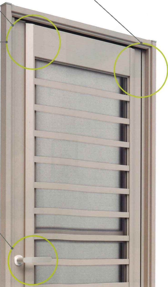
J型 シャイングレー