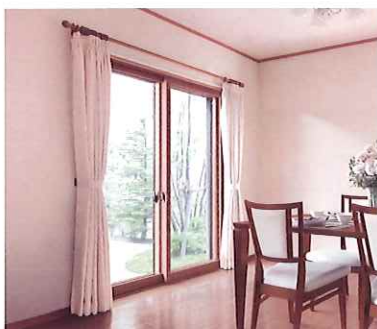
断熱内窓 (二重窓) インプラス

今ある窓の内側に新しい窓を取付けるだけ。1窓最短 1時間のスピード施工で断熱性がアップして、結露も軽減します。