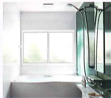
取替窓 リプラス カバーモール浴室用

窓のすきま風や寒さのお悩みも、浴室のリフォームと一緒に古い窓も取り替えリフレッシュ。プラインドイン複層ガラスやフロスト複層ガラスなど外からの視線をカットするガラスもおすすめ。