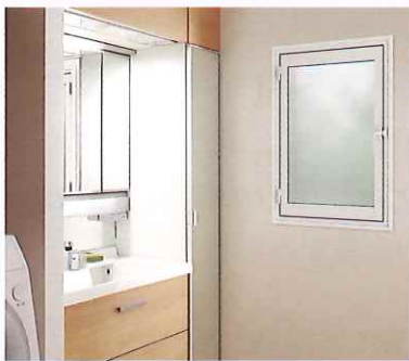
断熱内窓（二重窓） インプラス

脱衣室の小窓や浴室の窓におすすめ。今ある窓の内側に新しい窓を取付けるだけ。 1窓最短1時間のスピード施工で断熱性がアップして、結露も軽減します。