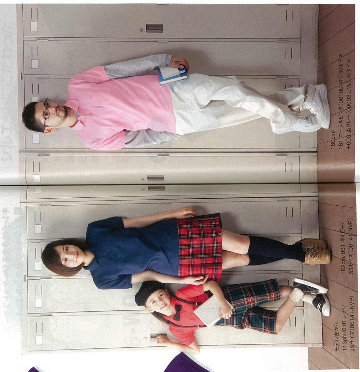
モデル左から: 113cm/010 レッド/ JSサイズ (00141-NVP)

編地の解説 紺=綿 白=ポリエステル 肌側に吸汗性に優れたポリエステル糸を使用。外側は凸状をしており、表面積が大きく、吸収した汗を速やかに乾燥させます。また、綿糸を交織させることで肌触りや吸湿性を高め、快適な着用感が得られます。