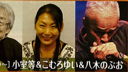
[15:00~] 小室等&こむろゆい&八木のぶお