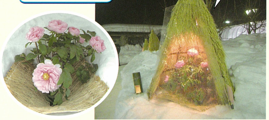
冬咲きぼたんまつり