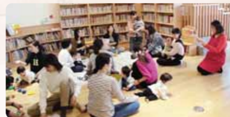
おやこ広場で、お子さんと一緒に話を聞くことができます。