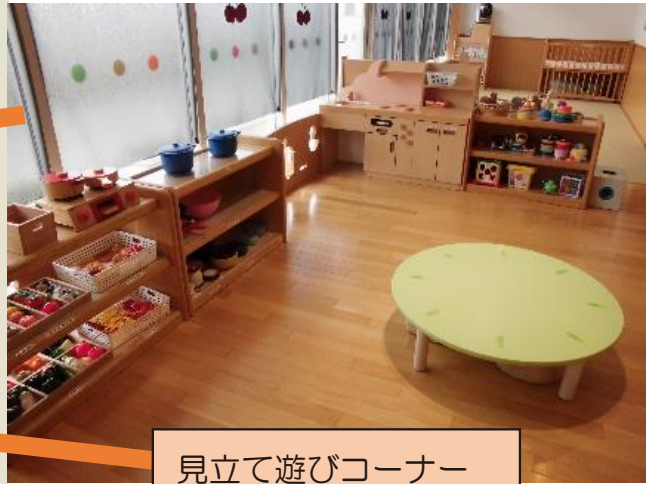
見立て遊びコーナー