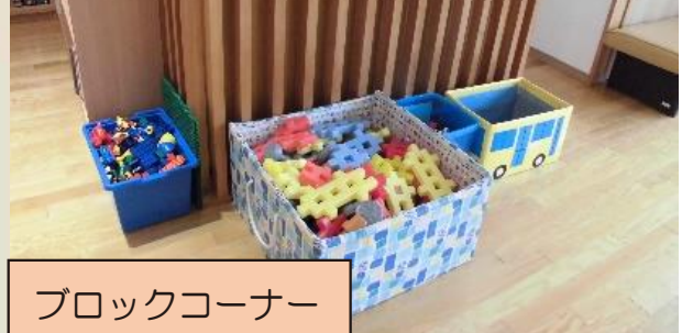
ブロックコーナー