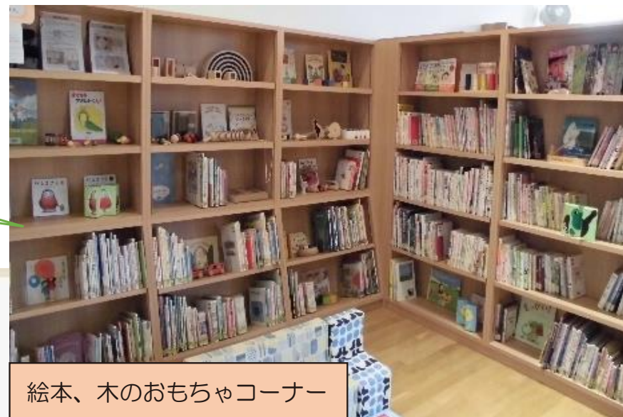
絵本、木のおもちゃコーナー