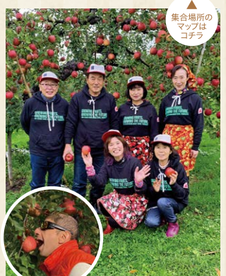
集合場所のマップはコチラ

最上川を眼下に見下ろす果物園で美味しい空気をいっぱい吸いながら旬のスイモ・ブルー・リンゴなどが30分食べ放題!さらに果物2個のお持ち帰り付き。その後、GUEST HOUSEの庭で、自家製夏野菜と美味しいお肉もいかがでしょうか。