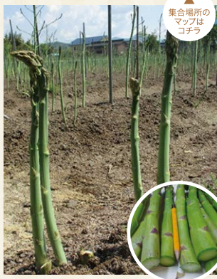
集合場所のマップはコチラ

昼夜の寒暖差が大きい地域で、徹底した水管理と東北有数の飼育頭数を誇る尾花沢牛がもたらす有機肥料で育まれた「銀山あすばら」は、根元まで甘く、うまみの濃い味わいです。