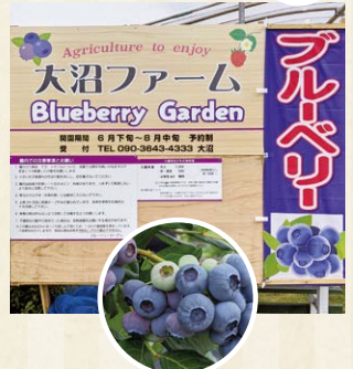
集合場所のマップはコチラ

無農薬栽培のブルーベリー摘み取り体験はいかがですか。なんと時間無制限食べ放題+ブルーベリー100gのお土産付き!親子でのお出かけにおススメです。品種ごとに甘味や酸味が異なるので、食べ比べをするのも面白いですよ。