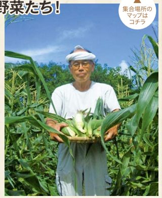
集合場所のマップはコチラ

収穫体験の王道を味わえるのがここ!一面に広がる畑に、なす、キュウリ、トマト、枝豆、ピーマンなどの夏野菜を収穫することができます。採りたての野菜をお持ち帰りができます。