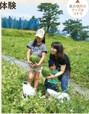
集合場所のマップはコチラ

すいか作り50年!昔からEM農法を取り入れ、農業や化学肥料を通常栽培で使用する分の半分以下に抑えて、安全でおいしいスイカ・かぼちゃなどの野菜作りをしています。