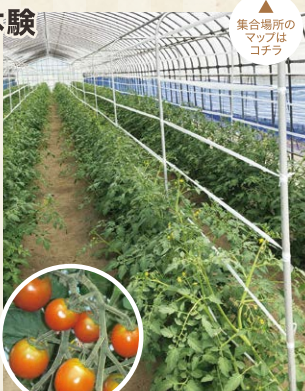
集合場所のマップはコチラ

トマト栽培28年のベテラン農家が育てるトマト「カンパリ」が収穫できます。糖度だけでなく適度な酸味のバランスで味が濃いおいしいトマトはいかがでしょう。