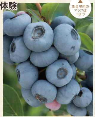
集合場所のマップはコチラ

30年以上ブルーベリー栽培に取り組み、現在では3,000本以上のブルーベリーを育てています。寒暖の差がある尾花沢で育つブルーベリーは大粒で、酸味・甘味のバランスもよく食べごたえ十分!