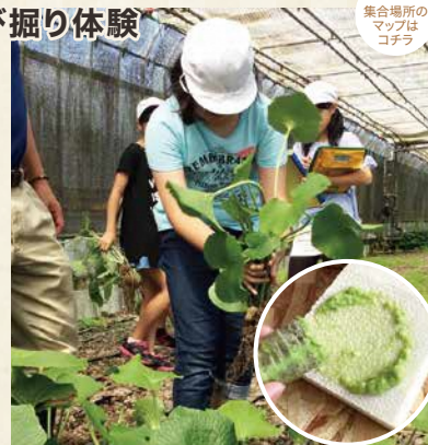
集合場所の マップは コチラ

集合場所 大富農産 東根市羽生字向野1088 時間 11:00集合~12:00解散 料金 1,500円/人(株わさび1株 をお持ち帰りいただけます) 定員 2人以上30人以内(小学生以下、 親子2人で1株などは要相談) 予約先 大富農産 TEL 0237-47-1003 E-mail hirano@yamagatawasabi.jp 予約条件 メールでの受付対応 となります その他 動きやすい服装・靴で