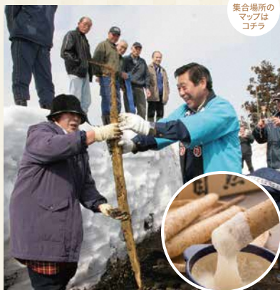
集合場所の マップは コチラ

集合場所 有限会社明電 大石田町大字横山99-1 時間 10:00集合~11:30解散 料金 2,400円/人(一団体4人 まで。自然薯1本をお持ち 帰れます) 定員 1人から10人まで 予約先 尾花沢市観光物産協会 TEL 0237-23-4567 FAX 0237-23-4568 予約条件 予約はTELで実施日の2日前まで