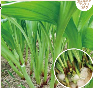
集合場所の マップは コチラ

集合場所 やくし食品 尾花沢市新町3-11-16 時間 10:00集合~12:00解散 大人2,000円/人(行者に んにく500gお持ち帰りで きます) 定員 2人以上30人以内 予約先 尾花沢市観光物産協会 TEL 0237-23-4567 FAX 0237-23-4568 予約条件 予約はTELで実施日の2日前まで