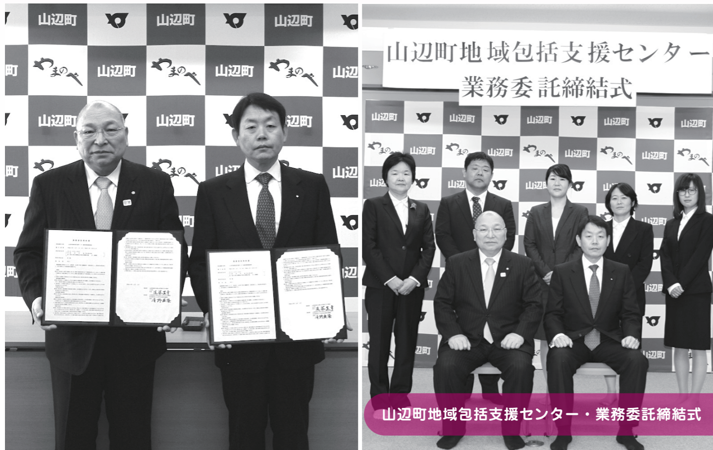
山辺町地域包括支援センター・業務委託締結式