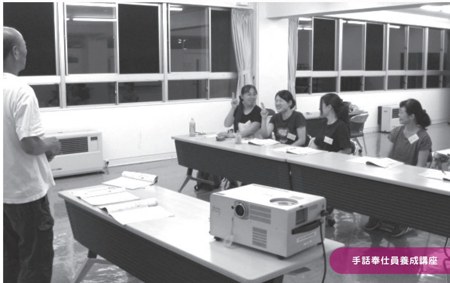
手話奉仕員養成講座