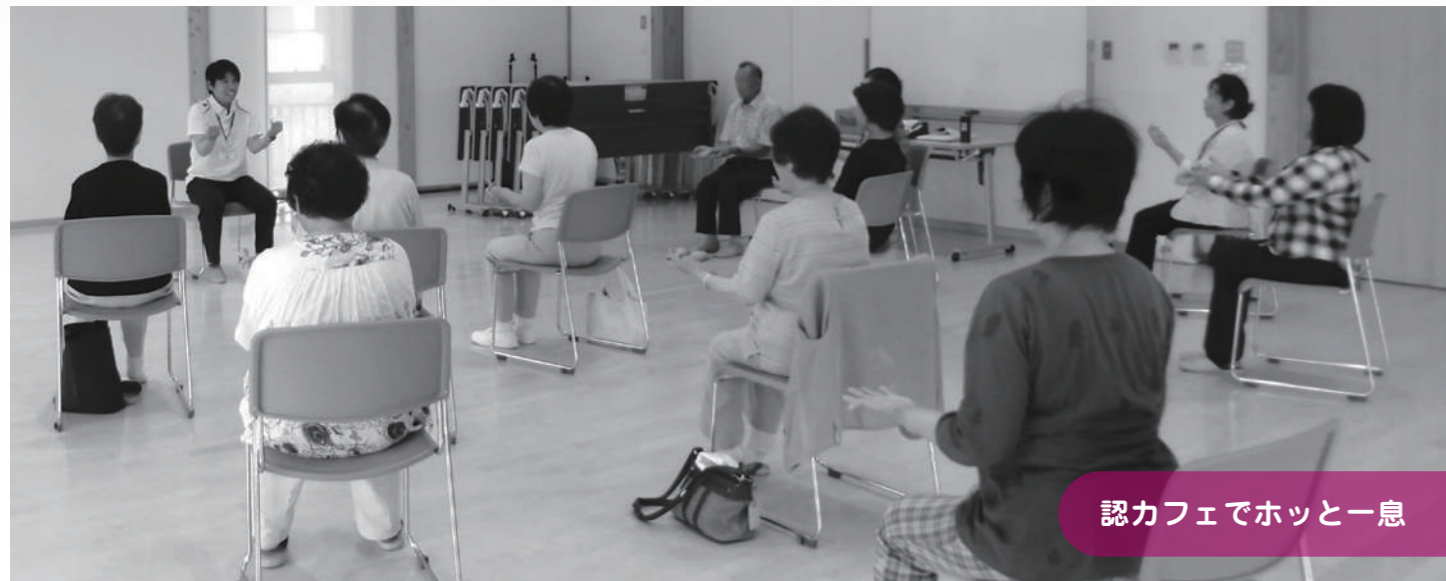
認カフェでホッと一息