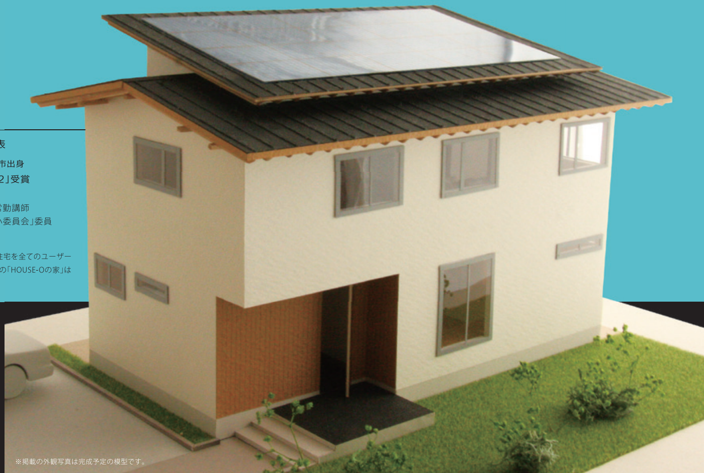
※掲載の外観写真は完成予定の模型です。

BDAC=Style。それは誰もが憧れる著名建築家によるデザイナーズ住宅を全てのユーザー様にお届けすることを実現した全く新しい住まいのカタチです。今回の「HOUSE-Oの家」は櫻井建設と建築家 瀬野和広氏のコラボによるデザイン住宅です。