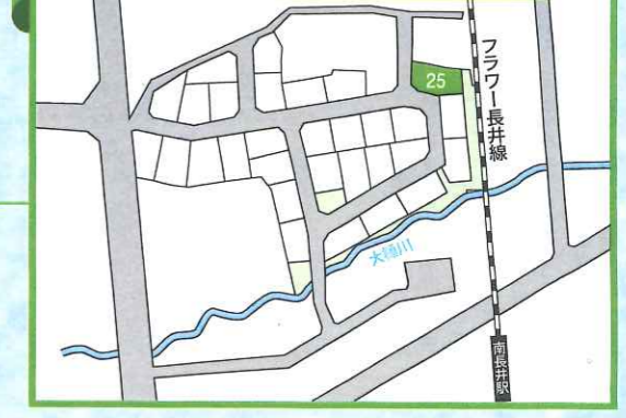
花咲きタウン みずはの郷 WEST 分譲区画図