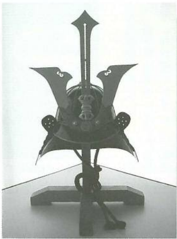
○三鍬形が実物と同じに改良された 義光役兜!!