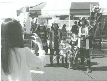
○最上義光武将隊発足!! 「山形まるごとマラソン2014」と「街なか賑わいフェス」に出陣!!