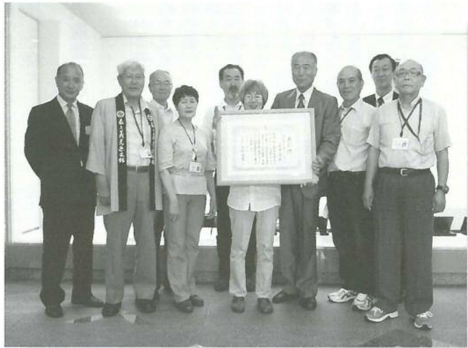
○祝!! 義光会が山形市制施行125周年記念功労表彰を受賞