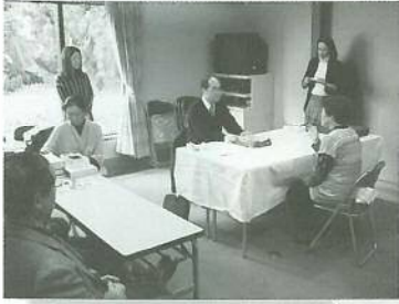
○「出張！古文書長屋 in 最上義光歴史館」 古文書の相談承ります