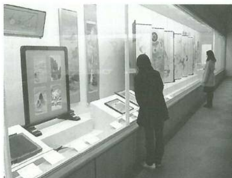
○大好評の市民の宝モノ2015高嶋祥光展!! 市民から多数ご出品いただきました

※最上義光歴史館の最新情報は 公式ホームページをご覧ください。 http://mogamiyoshiaki.jp