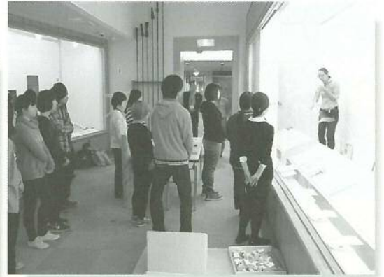
○山大博と初コラボ!! 企画立案から展示作業まで 学生さんたちが参加した展覧会です