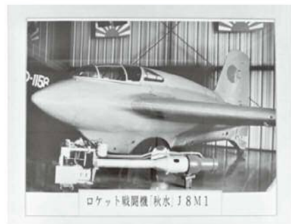
※ロケット戦闘機「秋水」J8M1 写真 (本機はプレーンズ・オブ・フェイム航空博物館に展示されている)