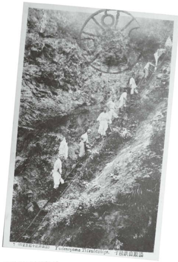
※天狗岩(山寺名勝)【左下】 ※湯殿山鉄梯子(三山神社参拝記念絵葉書)【右】 ※マリア園お祈り(鶴岡私立マリア園増築記念絵葉書)【左上】

山形大学附属博物館と最上義光歴史館の連携展は、山形大学において学芸員資格取得を目指す学生たちが3年間の学びの総仕上げとして取り組む展示です。大学生が若い感性で山形大学附属博物館が長年収集し保存してきた貴重な資料の新たな魅力を引き出すことを試みます。